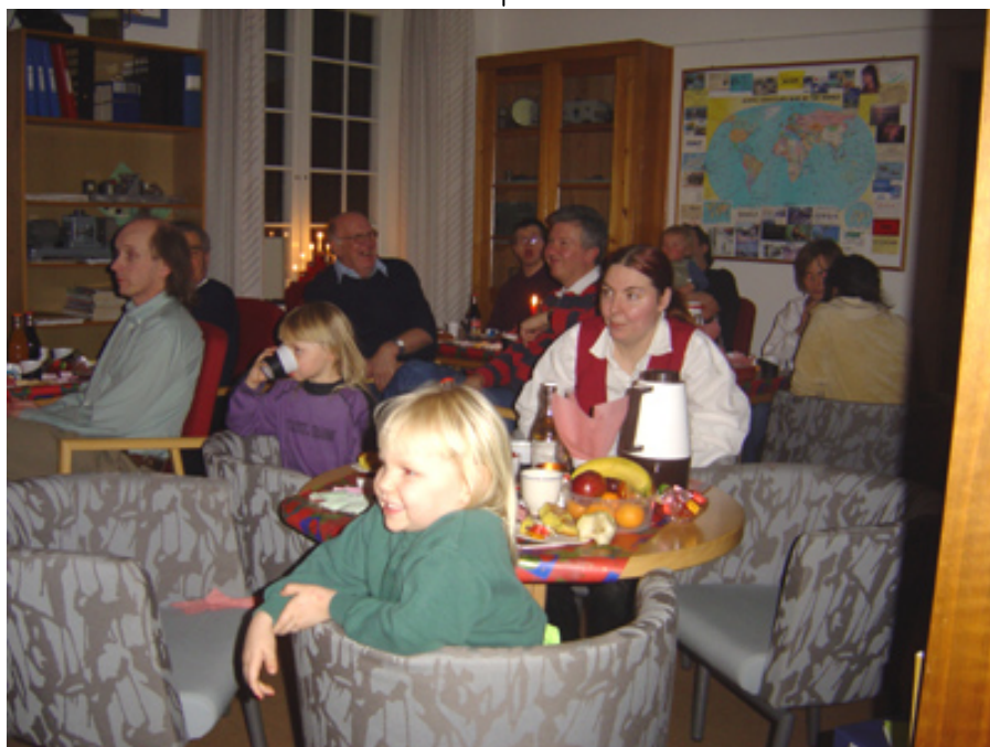
Intresset för "pappers-TV" var stort hos den yngre generationen, men även de övriga skrattade gott.